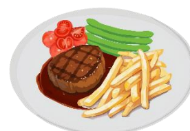
Steak Delicious food